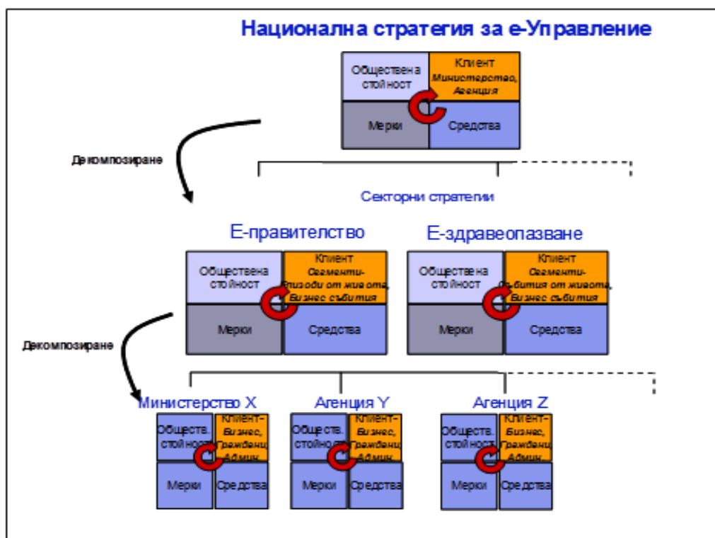
Фиг. 1 Декомпозиране на Стратегията за е-управление 2014-2020

Създаването на индивидуални, но съобразени с целите на отделните администрации пътни карти на база на Пътна карта към стратегията за е-управление 2014-2020 ще осигури връзката с общите цели, улеснява разбирането и възприемането на показателите и позволява детайлизирането и/или обобщаването на данните. По този начин всяка администрация конкретизира своите цели на една обща основа, гарантирайки гъвкавост и еднозначност при оценка на резултатите – на база ясни критерии и показатели. Тази логика е илюстрирана на фиг. 1: