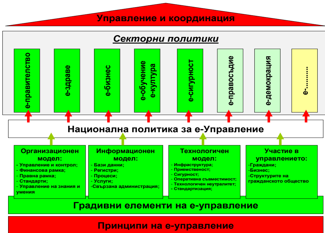
фиг. 3 Модел на е-управление