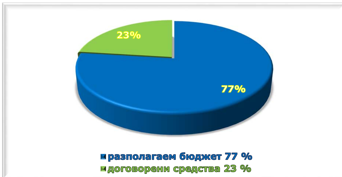
Фигура 2. Дял на договорените средства от бюджета на ОП НОИР

Общо от началото на програмния период (2014 – 2016 г.) договорените средства са в размер на 316 028 241,98 лв., което представлява 23,04 % от целия бюджет на ОП НОИР.